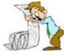
Planning en Prioritering