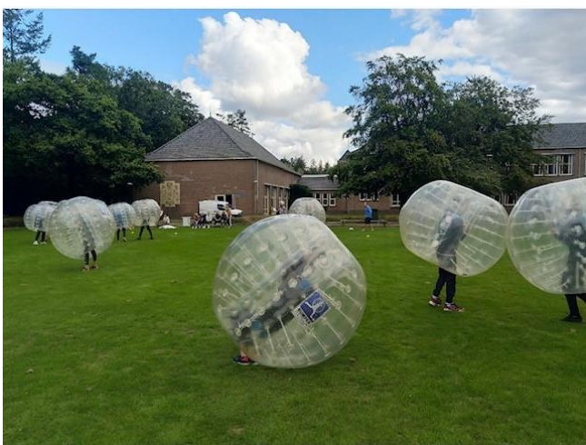
Foto: Kennismaking vwo-3, volledig corona-proof

Ik denk dat zij zich snel thuis zullen voelen op De Breul. De leerlingen van klassen 2 t/m 6 waren over het algemeen blij elkaar weer te zien. Voor de zomervakantie waren de groepen immers kleiner.